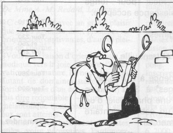
Sans paroles (Dessin de Moese- Cosmopress)

naissent l'envie, les querelles, les calomnies, les mauvais soupçons». Une chose reste sûre: l'amour bannit le soupçon. Pasteur J.-R. L.