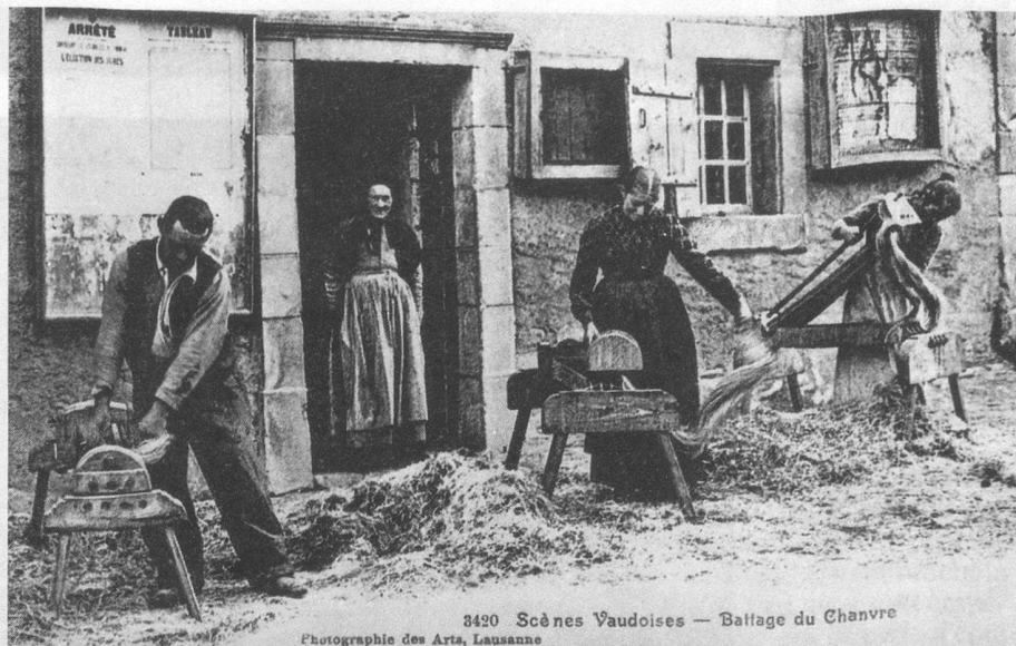
3420 Scènes Vaudoises — Battage du Chanvre