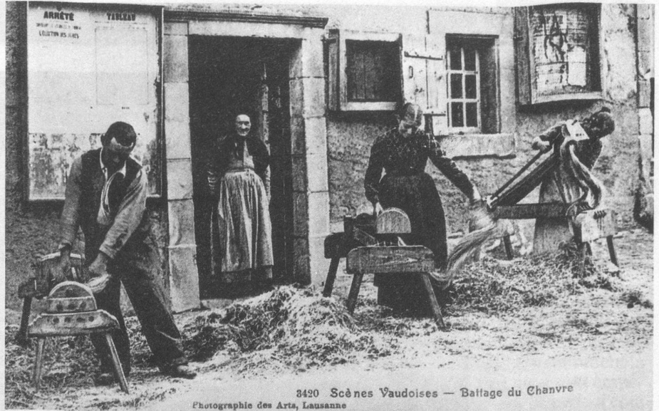
3420 Scènes Vaudoises — Battage du Chanvre Photographie des Arts, Lausanne