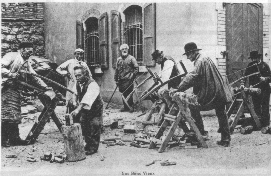
Nos Bons Vieux