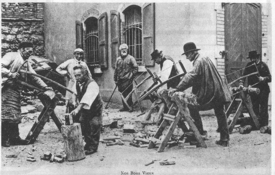
Nos Bons Vieux