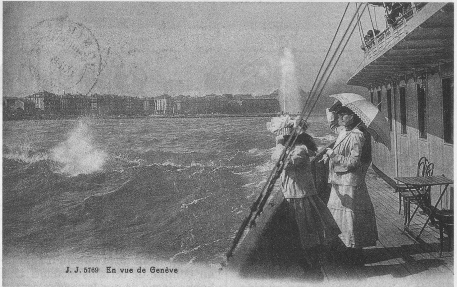
J. J. 5769 En vue de Genève