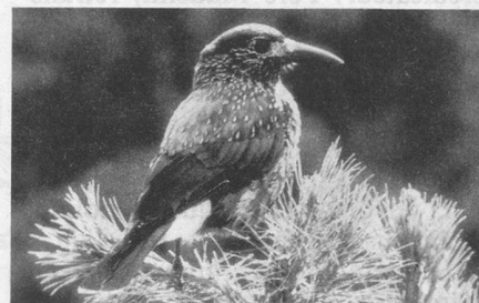
Le Cassenoix, l'aide forestier parmi les oiseaux, transporte et cache les graines d'aroles dans la terre. Il contribue ainsi au rajeunissement des forêts d'aroles.

Pour répondre aux nombreuses questions que se pose tout un chacun au sujet du dépérissement des forêts, la Station ornithologique suisse a lancé un programme de recherche sur l'écologie des oiseaux forestiers. Pour informer le public, une brochure attrayante et illustrée de photos en couleur a été éditée.