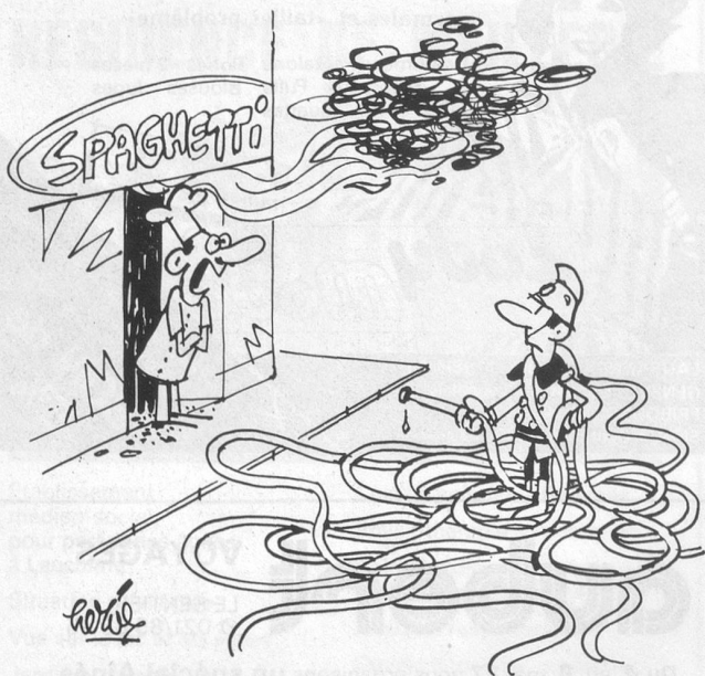
– Vous voulez peut-être une fourchette et du parmesan... (Dessin de Hervé-Cosmopress)