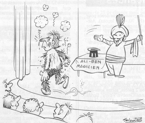
Y a-t-il un autre volontaire pour la démonstration? (Dessin de R. Sabatès)