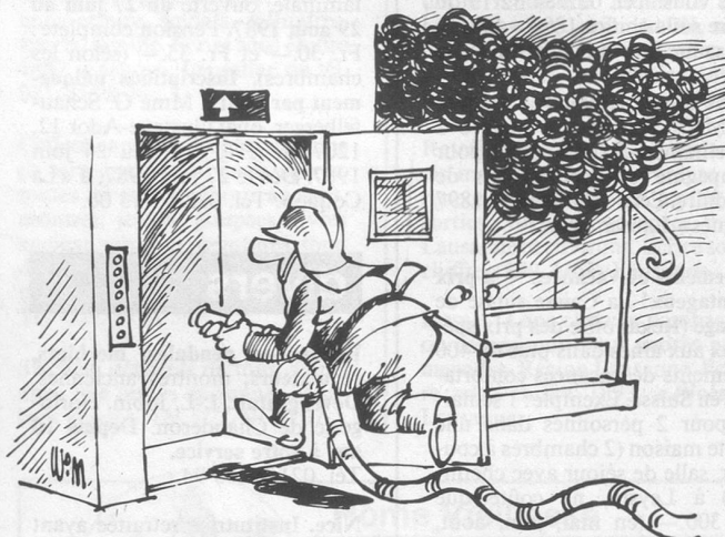
Sans paroles (Dessin de Moese-Cosmopress)