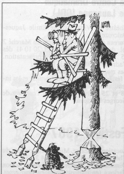
Sans paroles (Dessin de Moese-Cosmopress)

Tous nos voyages sont accompagnés du départ au retour en Suisse.