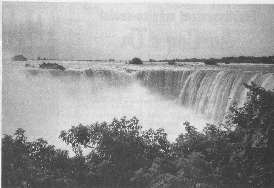
Les chutes du Niagara, à la frontière du Canada et des Etats-Unis.

Le Canada est un grand continent qui flotte sur l'eau; c'est du moins ainsi qu'il nous apparut lorsque nous l'avons aperçu pour la toute première fois depuis l'avion. Ce pays boisé et très vert évoque une immense forêt dans laquelle on aurait oublié quelques maisons qui s'illuminent dans le coucher du soleil. Cette impression d'immensité ne fera que se renforcer au cours des jours suivants. Notre visite de l'Université de Québec elle-même la confirmera: ici, on peut bâtir largement. Les limites du campus semblent se confondre au loin avec l'horizon et le ciel changeant. Nous irons ensuite de découverte en découverte: Québec, à laquelle la brume et la pluie donnent une dimension toute particulière, la rivière Chaudière, la Beauce et ses érablières, l'Université de Sherbrooke, Montréal, toute faite