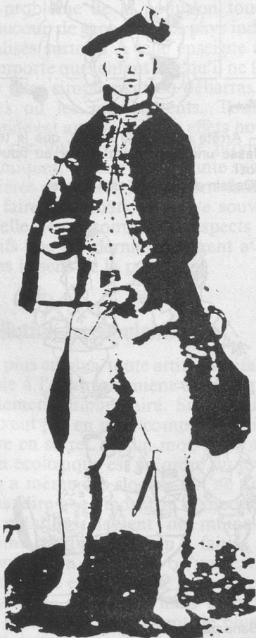
Sergent des fusiliers royaux de Naples

«Nous étions jeunes alors... vingt, vingt-cinq ans au plus. Le travail manquait en Gruyère, comme partout dans le pays. Beaucoup étaient déjà partis pour les Amériques. On disait que là-bas on vous donnait de la terre à culti-