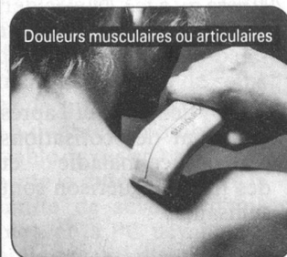
Douleurs musculaires ou articulaires

Nul ne doute plus aujourd'hui de l'action anti-douleurs de l'énergie statique, utilisée dans ce but depuis plus de 50 ans. Cette énergie est maintenant domestiquée dans le STATIQUICK!