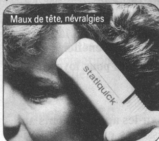
Maux de tête, névralgies

alors le STATIQUICK est la solution à vos problèmes!