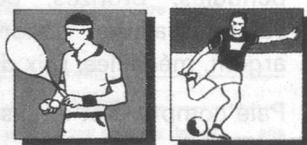
Tendo-vaginite des joueurs de tennis, blessures du sport, massages.