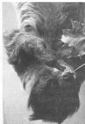
L'unau didactyle, ou paresseux. Des étreintes de quarante-huit heures.

C'est un petit mammifère solitaire d'une extrême lenteur qui vit accroché, la tête en bas, dans les arbres des forêts humides de l'Amérique centrale et du nord de l'Amérique du Sud. Petite tête arrondie à face aplatie, il mesure 50 à 60 cm de long et pèse 3 à 4 kg. Son pelage long et épais (pour l'isoler de la chaleur du jour et du froid de la nuit) est beige-brun grisâtre, recouvert d'un camouflage verdâtre composé d'algues microscopiques. Ses mains et ses pieds sont terminés par de longues griffes (8 à 12 cm) incurvées en forme de faucilles, qui lui permettent de crocheter son chemin dans les arbres avec dextérité et d'y rester accroché sans effort pendant ses quatorze à dix-sept heures