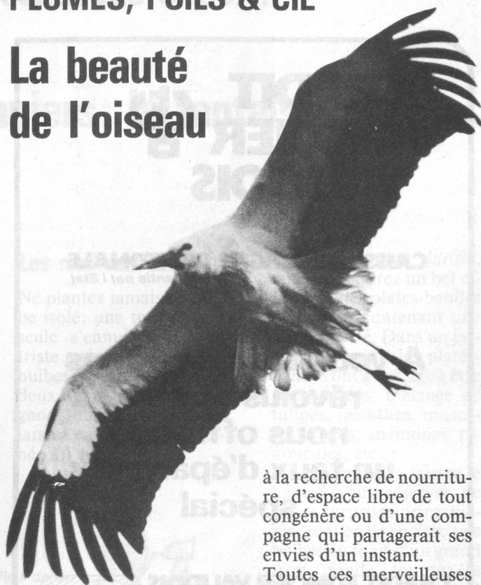
Cigogne rejoignant son nid à Altreu/SO.