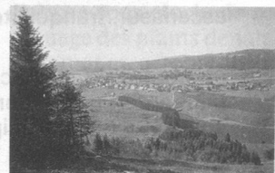
Vue de L'Auberson, une région jadis riche en fer.

Depuis longtemps, les ducs de Savoie tentaient par la ruse et par la force de s'emparer de Genève et d'en faire l'une de leurs villes sujettes. Pour les aider à réaliser cette ambition, des nobles savoyards mais aussi vaudois auxquels, d'ailleurs, s'était joint le comte de Gruyères formèrent une ligue dite des «Chevaliers de la cuillère».