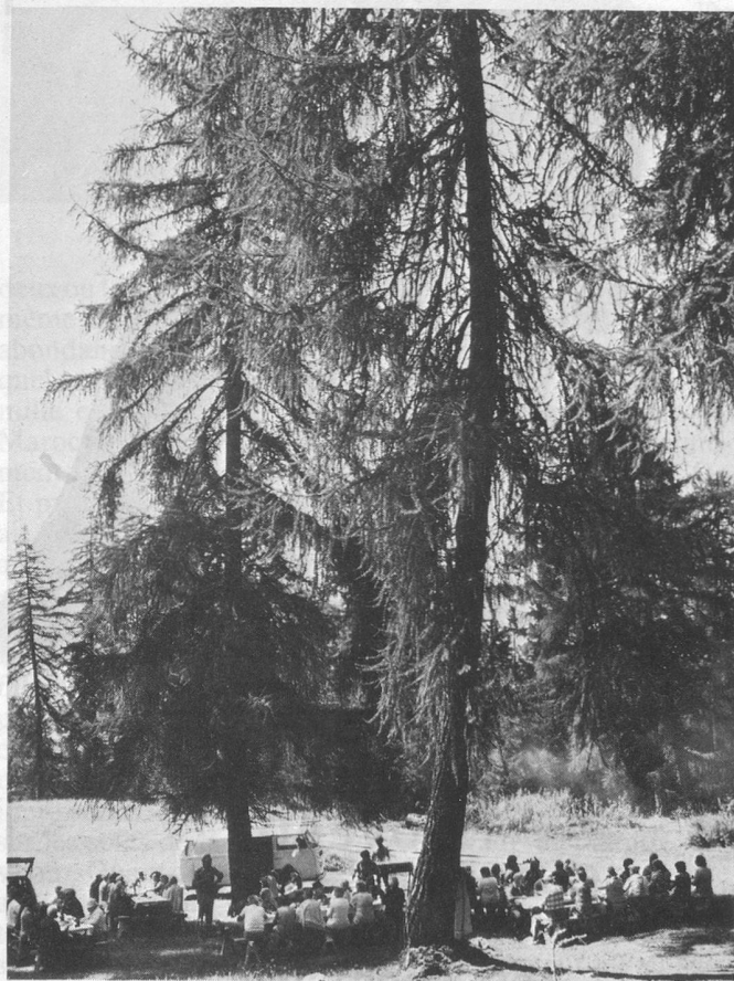
Octobre, c'est encore le temps des joyeux pique-niques.

Mes escargots ne mènent plus leur train de sénateur: depuis le début du mois, ils se sont enterrés comme des fakirs à cornes: ils hibernent. Pas de