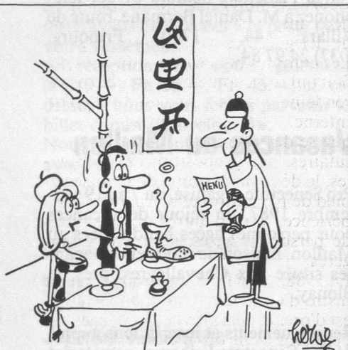
— J'ai dû me tromper dans la prononciation du Pâté Impérial... (Dessin de Hervé-Cosmopress)