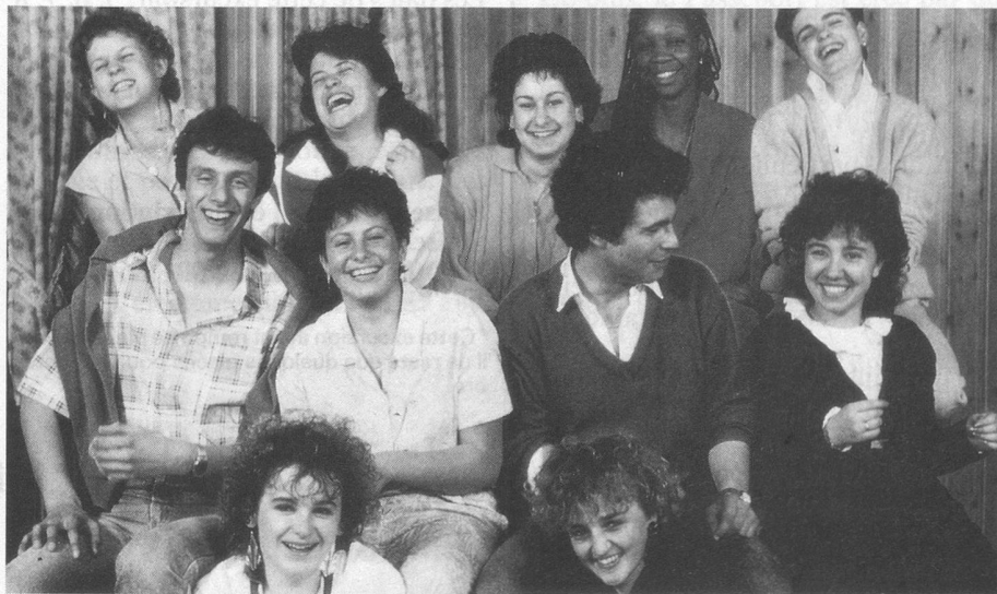
Des jeunes, cœur ouvert, sans idées préconçues.