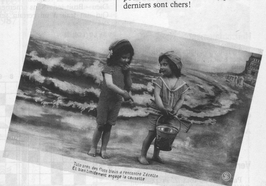
Toto près des flots bleus a rencontré Zézette Et bien timidement engagé la causette

Aujourd'hui, ce sont les marchands de tissus qui rient: moins ils en vendent pour les costumes de bain, plus ces derniers sont chers!