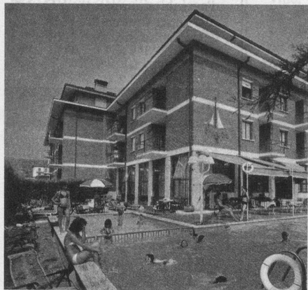
Bardolino - Vérone: l'hôtel Idania

Prestations: voyage en car, logement en hôtel 3*, pension complète, 3 spectacles aux arènes de Vérone , les excursions.