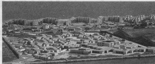
Port Barcarès: le village-vacances L'Estanyot

(Reprise après quelques années d'un séjour fort apprécié et de surcroît avantageux).