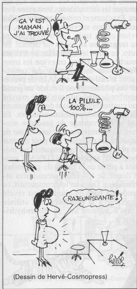
(Dessin de Hervé-Cosmopress)