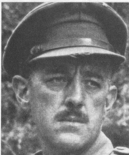
Le Pont de la rivière Kwai — 1957

tant une petite danse ridicule, me rendant compte que ma braguette était ouverte ou même me trompant de théâtre... Malgré toutes les angoisses qu'ils m'avaient procurées dans la journée, les films n'étaient jamais venus troubler mes nuits...» C'est ainsi qu'Alec Guinness, bien qu'il aimât le cinéma, avait, malgré ses cauchemars cette passion pour le théâtre qu'il exprime dans ses Mémoires .