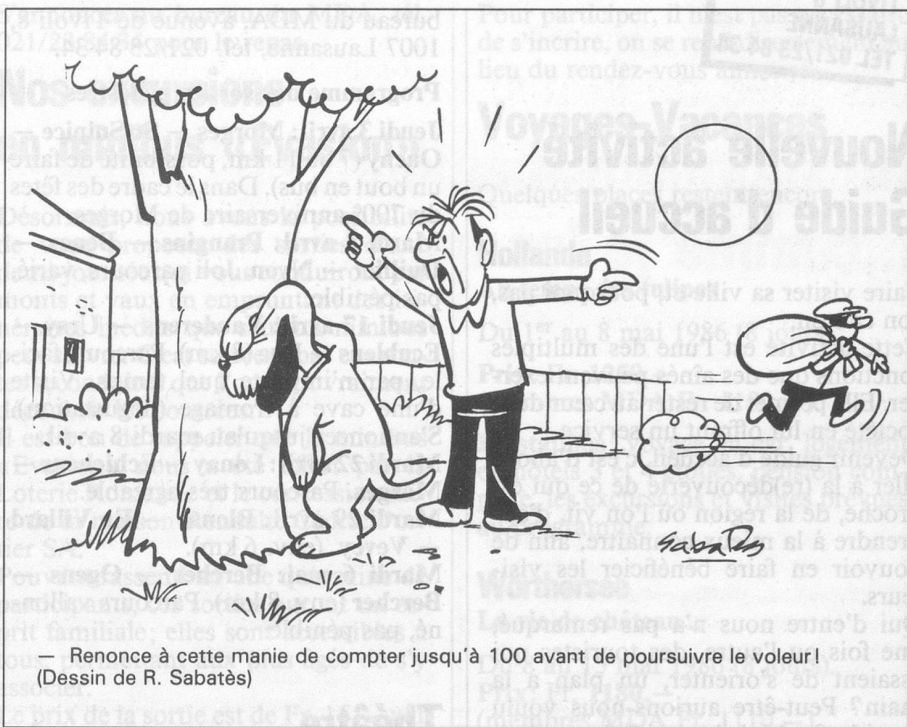
Renonce à cette manie de compter jusqu'à 100 avant de poursuivre le voleur!