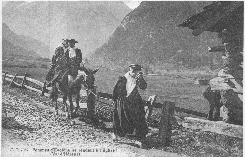
J. J. 7087 Femmes d'Evolène se rendant à l'Eglise (Val d'Hérens)

Notre clin d'œil de ce mois est destiné au Valais, pays merveilleux où la tradition a toujours été respectée avec ferveur et où, aujourd'hui encore, on constate facilement la survie des coutumes d'antan.