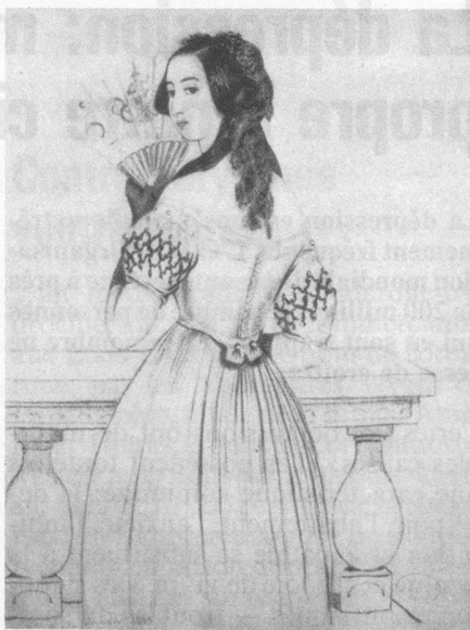
George Sand dessinée à Venise par Alfred de Musset (Bibliothèque Spoelberch, Chantilly)

Dans notre jeunesse, nous lisions les romans de George Sand, La petite Fadette ou François le Champi , dont nos maîtres nous faisaient admirer la pro-