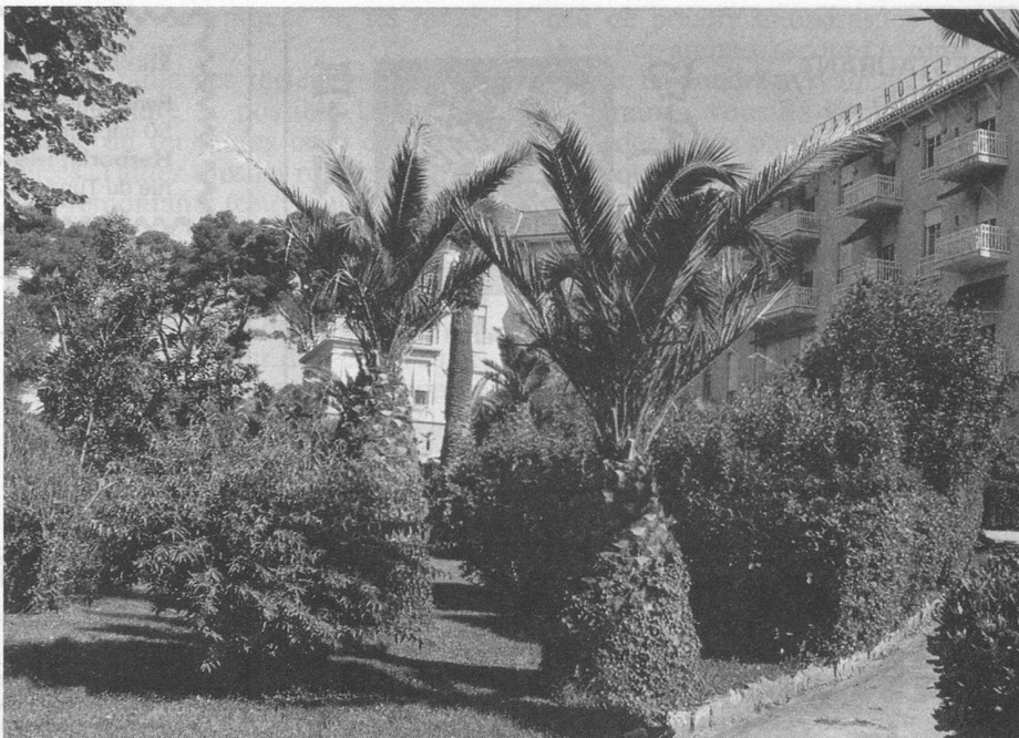
Le Grand-Hôtel, établissement de premier ordre.