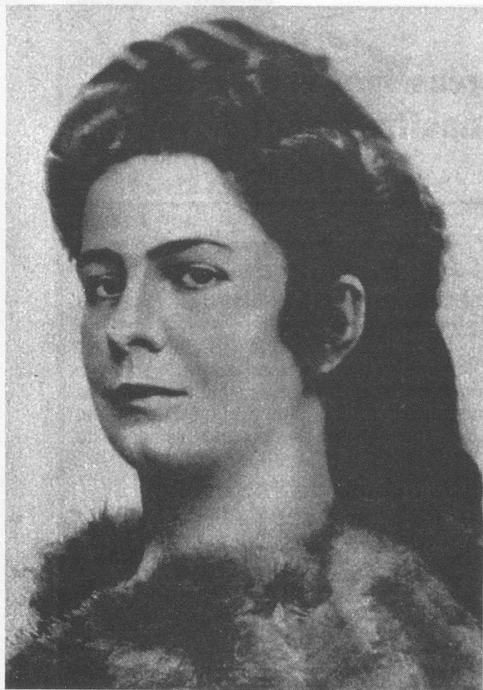
L'impératrice Elisabeth d'Autriche.

provoquer son entourage. Elle irrita la Cour en organisant des bals dans ses appartements, sans inviter les mères des jeunes filles comme il était d'usage. Elle dansait avec une fougue qu'on ne lui avait jamais connue et, quand elle participait à des bals privés, elle ne rentrait au palais qu'à des heures peu protocolaires.