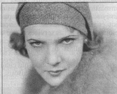
L'actrice Elissa Landi.