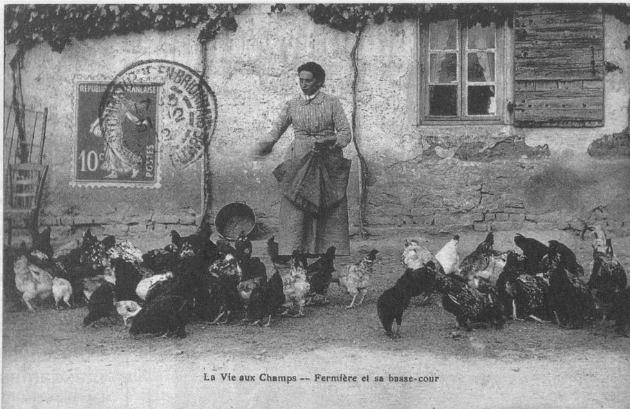
La Vie aux Champs -- Fermière et sa basse-cour