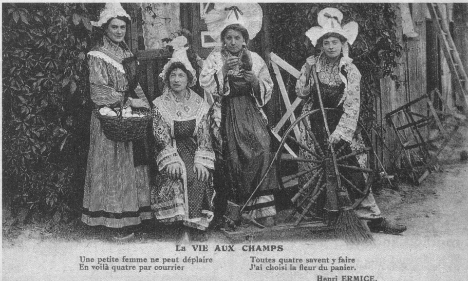
La VIE AUX CHAMPS