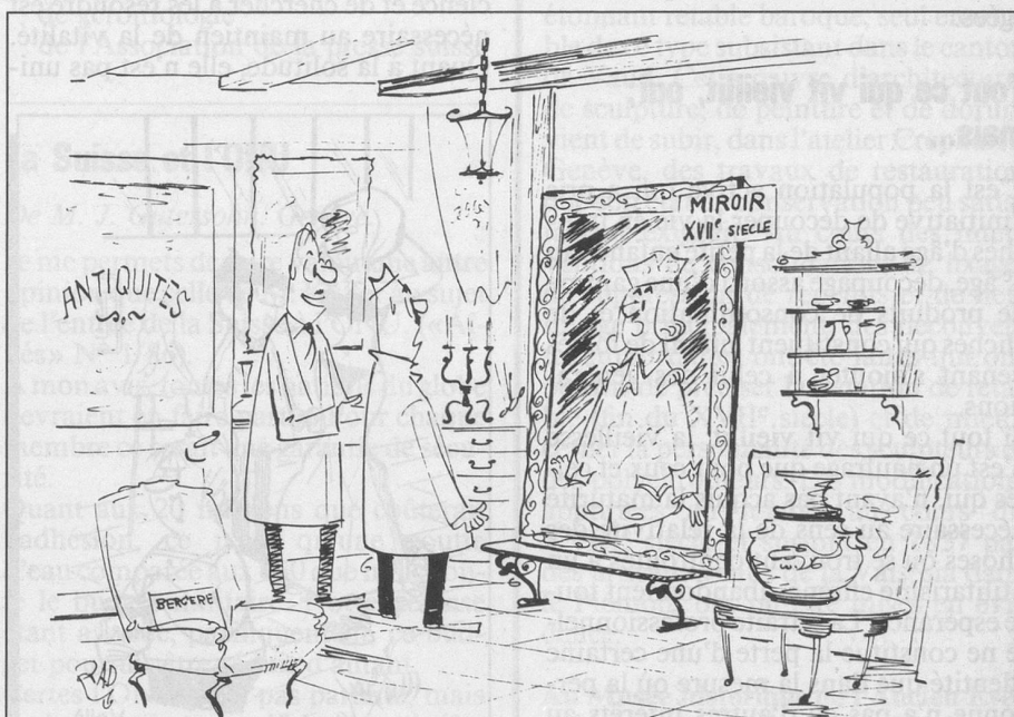
— Comme vous pouvez vous rendre compte, il est d'époque... (Dessin de Rad-Cosmopress)