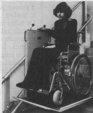
Modèle avec plateforme pour fauteuil roulant

Demandez-nous l'envoi d'une documentation illustrée gratuite. Mieux encore: la visite, sans engagement de votre part, d'un de nos techniciens qui vous conseillera utilement en fonction des lieux. Représentation et distribution exclusive pour la Suisse romande des monte-escaliers TLG Rigert