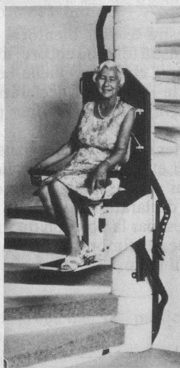
Modèle avec siège

Les monte-escaliers TLG Rigert pour escaliers larges ou étroits sur un ou plusieurs étages (fabrication suisse)