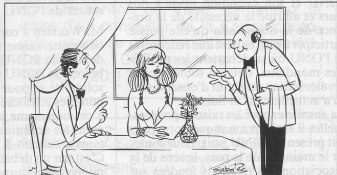
— Veuve Clicquot? — Non, c'est ma femme! (Dessin de Ramon Sabatès)

Réparations et révisions de pendules , morbières, pendulettes et montres anciennes. Devis gratuit, service à domicile. Horlogerie-Pendulerie de Chauderon, J.-L. Jobin. Tél. 021/24 40 94.