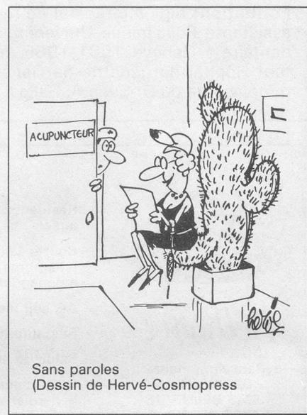
Sans paroles (Dessin de Hervé-Cosmopress)

Prix des deux volumes: Fr. 37.— + 800 points Mondo, ou en librairie: Fr. 86.— sans les points.