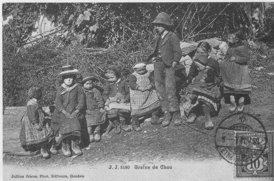
J. J. 8180 Graine de Chou