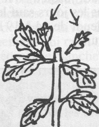
Supprimer les tiges latérales.