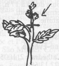
Pincer la tige principale.