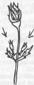
Eboutonnage d'un rosier.

tous les quinze jours, contre les pucerons et les maladies cryptogamiques. Ebourgeonnez les dahlias en pinçant la