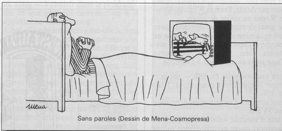
Sans paroles (Dessin de Mena-Cosmopress)