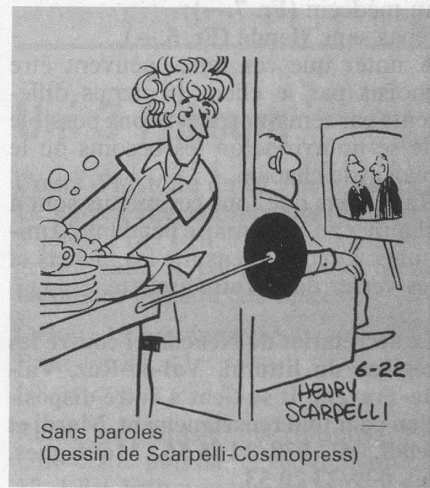
Sans paroles (Dessin de Scarpelli-Cosmopress)

Faites un essai. C'est vraiment très sympa. Tél. 22 20 71. E.H.