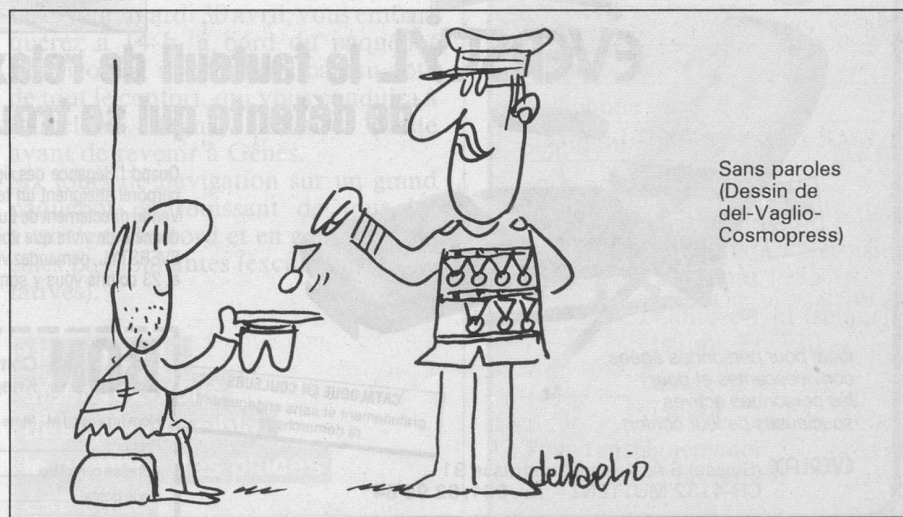
Sans paroles (Dessin de del-Vaglio- Cosmopress)

Avec ces changements, les banques suisses veulent faire de la carte eurochèque un «compte bancaire en poche».