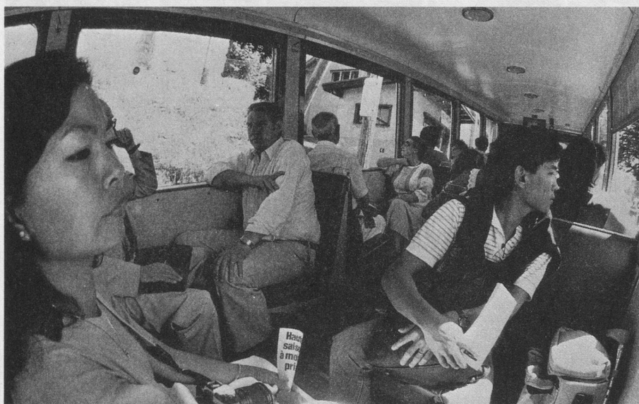
Des touristes du monde entier.

C'est cet ingénieur devenu grand patron du MOB qui a, entre autres, réalisé la télésurveillance et l'observation à distance de l'ensemble du réseau. Cette télésurveillance s'opère à la gare de Glion, aussi bien sur le Territet—Glion, le Montreux—Glion et le Glion—Naye. L'agent assumant la desserte de Glion contrôle directement de son bureau l'ensemble du réseau sur un écran de TV interne, ce qui lui permet de prendre sans délai et en connaissance de cause les décisions nécessaires pour faire face à n'importe quelle situation. Le contrôle du flux des voyageurs et l'organisation rationnelle de l'exploitation sont ainsi assu-