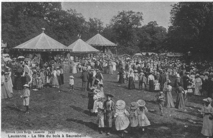
Editions Louis Burgy, Lausanne - 2493 Lausanne - La fête du bois à Sauvabelin

C'est aux manèges d'enfants que j'en ai aujourd'hui. Bien moins compliqués qu'aujourd'hui, ils sont liés à nos souvenirs de jeunesse de la période des examens et de fin de scolarité. Bien sûr, il y avait aussi des manèges d'adultes que l'on rencontrait surtout dans les parcs d'attractions: leur complexité technique interdisait généralement de les démonter et remonter chaque semaine. Et puis, il n'y avait pas