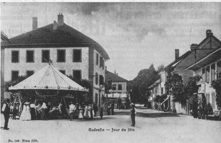
Cudrefin - Jour de fête

La Fête du bois à Sauvabelin s'est perpétuée jusqu'ici, mais je ne sais pas s'il y a encore des manèges. Cette carte démontre qu'il y a foule, aussi bien adulte qu'enfantine. Quant au carrousel sur la place de Cudrefin, il attire moins de monde. Toutefois, les pères sont là, surveillant les dépenses considérées des mamans et de leurs enfants.