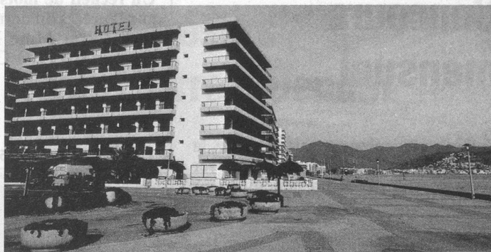
Hôtel Monte-Carlo Rosas

sable fin, sur la Costa Brava, à quelque 20 km de la frontière française: Rosas . Après avoir visité plusieurs hôtels, notre équipe a sélectionné un établissement moderne, très plaisant et confortable, meublé avec beaucoup de goût et situé directement au bord de la mer: l' Hôtel Monte-Carlo , de première catégorie. Chambres spacieuses, toutes avec bain complet/WC, terrasse avec vue sur mer, bar, salle de TV, grand solarium, 2 ascenseurs. Excellente cuisine internationale et variée. Un établissement offrant tout le confort et l'agrément souhaités, relié à la petite ville de Rosas par une promenade au bord de la mer sans circulation motorisée, ou par des bus.