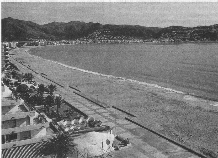
La plage de Rosas.

Voyage en train de luxe Catalan-Talgo de Genève à Figueras et retour; panier-repas; transfert de Figueras à Rosas et retour en car; (18 km), logement en chambre 2 lits (ou 1 lit avec supplément); pension complète; les excursions; les taxes et le service; l'accompagnement «Âînés» dès Genève. Le nombre de places étant limité à 48, nous conseillons aux personnes intéressées par ce séjour de s'inscrire dès que possible.