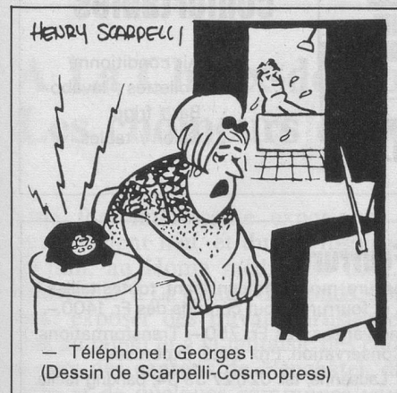
— Téléphone! Georges! (Dessin de Scarpelli-Cosmopress)

Nous avons le plaisir d'annoncer que désormais une permanence est assurée chaque vendredi matin de 9 à 12 heures, rue Saint-Ours 6, Genève (tél. 022/29 99 29) à l'Institut suisse de la vie. Bienvenue à tous.