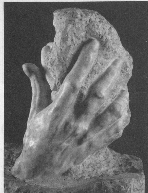
La main de Dieu.

l'hôtel Biron 2 quatre-vingt-cinq mains indépendantes auxquelles Rodin donna la vie, en marbre, en pierre, en terre cuite, en bronze noir. Ces mains agissantes et si diverses nous effraient, nous charment, nous émeuvent, nous bouleversent tour à tour. Il faut les regarder parler. Rodin a doté la main droite du pouvoir divin de créer, et la gauche de celui de détruire. Céleste et blanche, la Main de Dieu fait jaillir d'un bloc informe Adam et Eve. La Main du Diable, rapace et sombre,