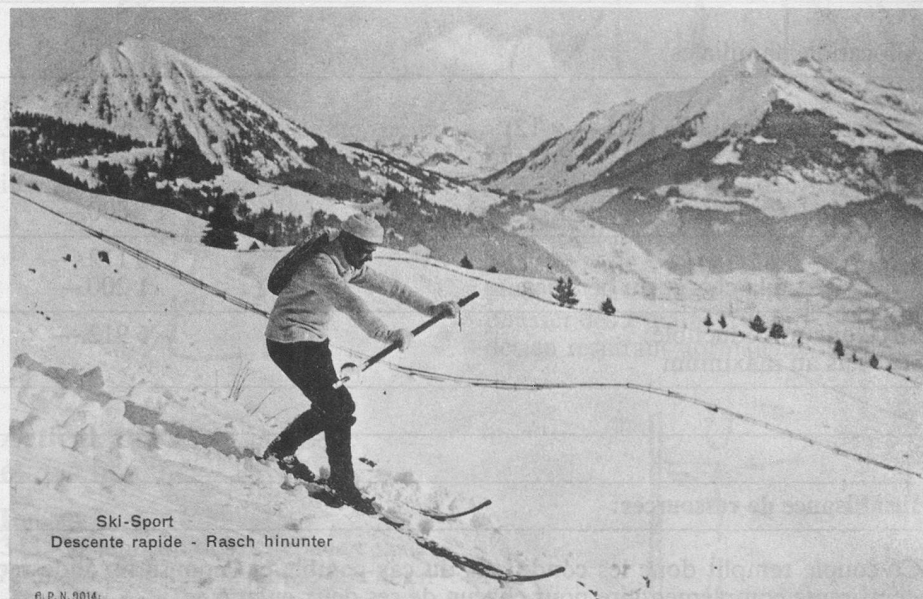
Ski-Sport Descente rapide - Rasch hinunter

Le bâton en mains était là pour permettre de freiner, entre les jambes, et de mieux terminer une majestueuse arabesque.