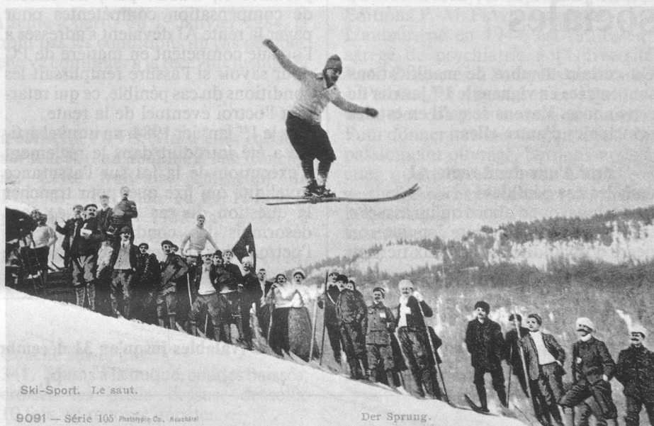
Ski-Sport. Le saut.

Alors, si vous songez à faire de l'ordre dans vos greniers, n'hésitez pas à demander mon aide, bien entendu gratuite. Et, à cette occasion, mêlant l'utile à l'agréable, je risque de trouver des cartes qui compléteront heureusement mes collections: j'en salive à l'avance! (J.-P. Cuendet, rue de la Gare, 1162 Saint-Prex).