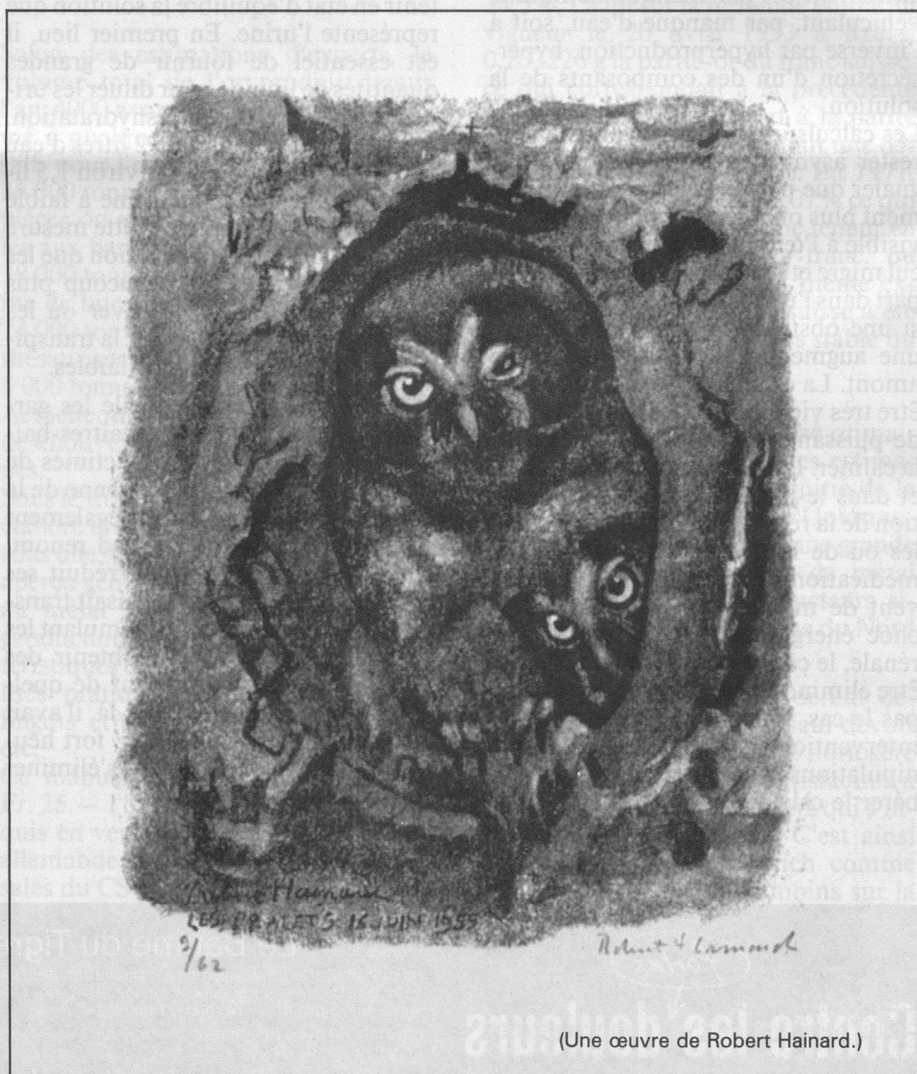
(Une œuvre de Robert Hainard.)