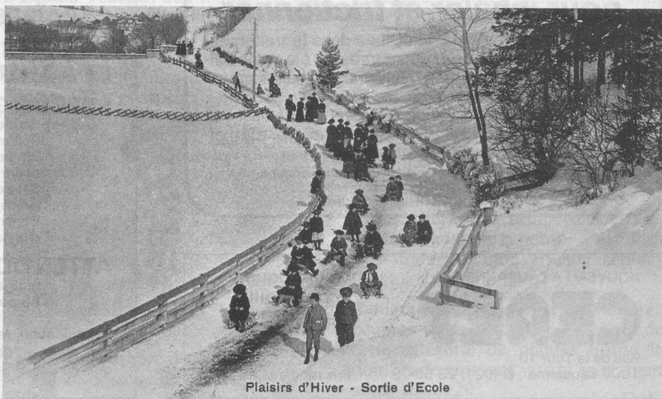
Plaisirs d'Hiver - Sortie d'Ecole