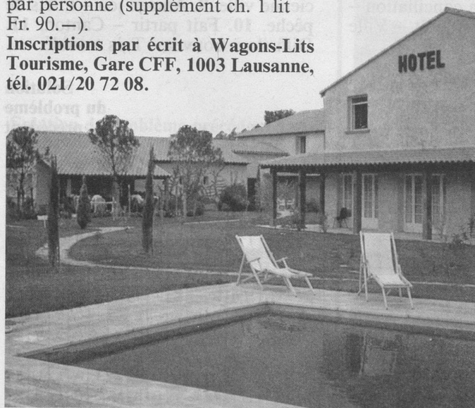
L'hôtel «Le Paradou».

Deux itinéraires séduisants pour passer agréablement les fêtes de fin d'année. Mais il est conseillé de ne pas trop attendre pour s'inscrire: le nombre des places est limité.