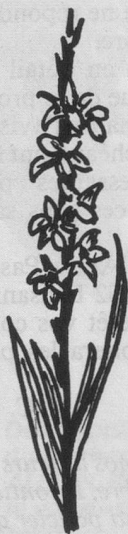
Glaieuls: laissez jaunir le feuillage.