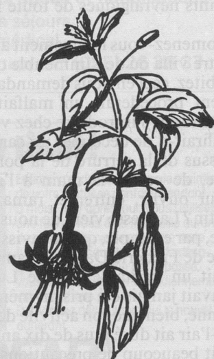
Fuchsias: rabattre les tiges à quelques centimètres.