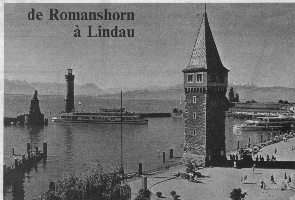
L'entrée du port de Lindau avec le Mangturm.

Pour de plus amples détails: Mouvement des Aînés, avenue Tivoli 8, 1007 Lausanne. Tél. 021/23 84 34 ou dans toutes les gares, ou encore au 021/20 50 33 (Gare de Lausanne).