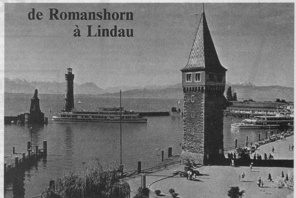
L'entrée du port de Lindau avec le Mangturm.

Pour de plus amples détails: Mouvement des Aînés, avenue Tivoli 8, 1007 Lausanne. Tél. 021/23 84 34 ou dans toutes les gares, ou encore au 021/20 50 33 (Gare de Lausanne).