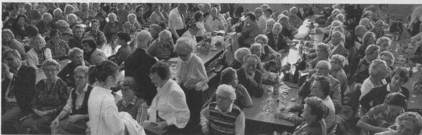
La foule attentive et enthousiaste des retraités réunis à l'occasion de ce 10 e anniversaire.

La partie officielle permit d'apprécier les messages du directeur de Pro Se-