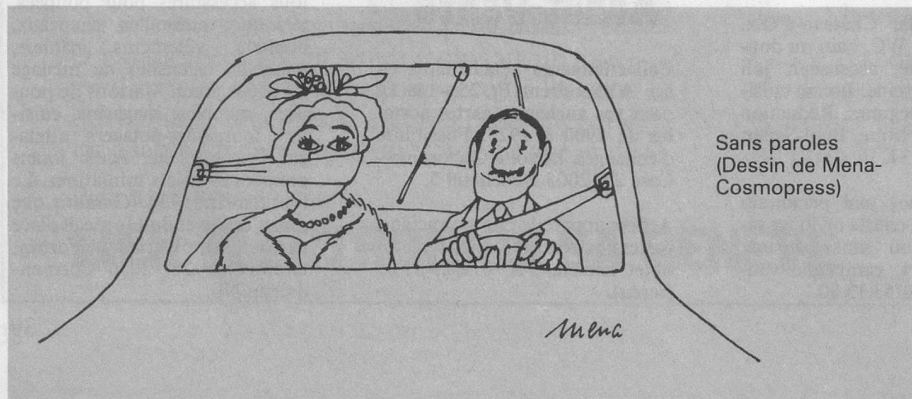
Sans paroles (Dessin de Mena-Cosmopress)

Un rentier AVS peut faire virer sa rente sur un compte de chèques postaux sans aucun frais. Si le CCP ne produit aucun intérêt, il n'occasionne pratiquement aucun frais à son titulaire, sans oublier que toutes les écritures sont effectuées dans un délai beaucoup plus rapide que dans le trafic bancaire. Rien ne l'empêche en outre de virer des sommes gratuitement à un compte bancaire productif d'intérêts. Il n'aura en outre plus à attendre au guichet postal puisqu'il lui suffira de transmettre ses ordres à son office de chèques, en glissant son enveloppe dans la prochaine boîte aux lettres. L'argent comptant pourra lui être aussi payé chez lui grâce au chèque payable à domicile, une exclusivité des PTT. Il peut user de cette possibilité par un simple coup de téléphone à son office postal (coût 80 centimes ou 3 francs en cas de distribution par exprès). Pour les personnes aimant voyager, le compte de chèques postaux est idéal. Plus de 4000 offices de poste sont à sa disposition pour des retraits d'argent le samedi matin également.