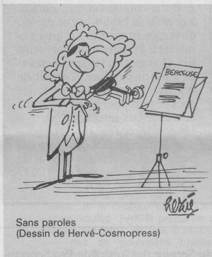
Sans paroles