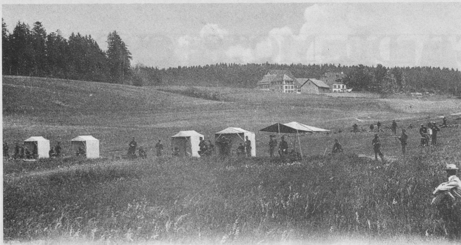
Châlet à Gobet — Le Camp de Tir