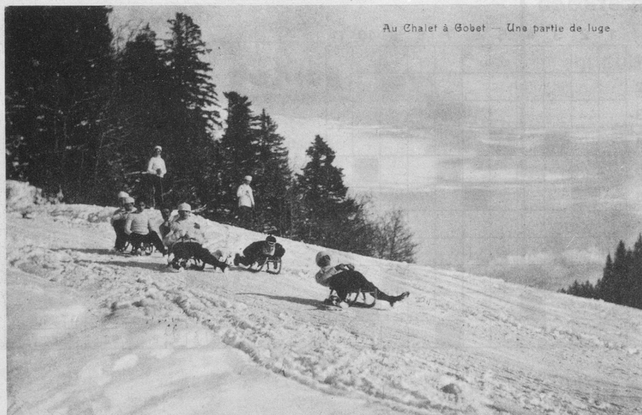
Au Chalet à Gobet — Une partie de luge

De tout temps, le Chalet-à-Gobet servait de station de sports d'hiver aux Lausannois, qui allaient patiner un peu plus loin, à Sainte-Catherine. Il n'y avait pas très longtemps que le tram du Jorat avait été mis en service et, grâce à ce moyen moderne de communication, les champs de neige et de glace étaient alors à proximité.