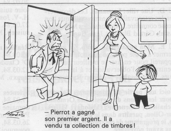
— Pierrot a gagné son premier argent. Il a vendu ta collection de timbres!