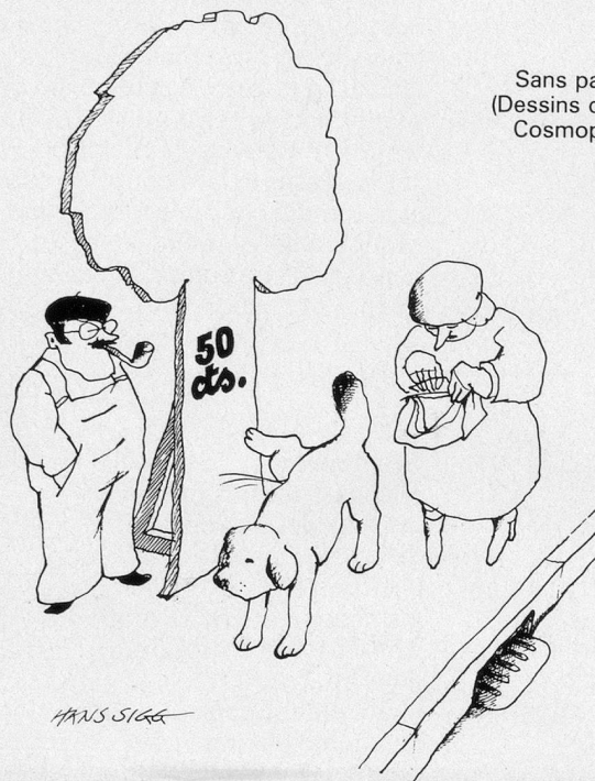
Sans paroles (Dessins de Sigg- Cosmopress)